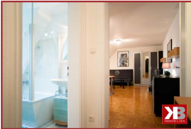
Blick vom Flur